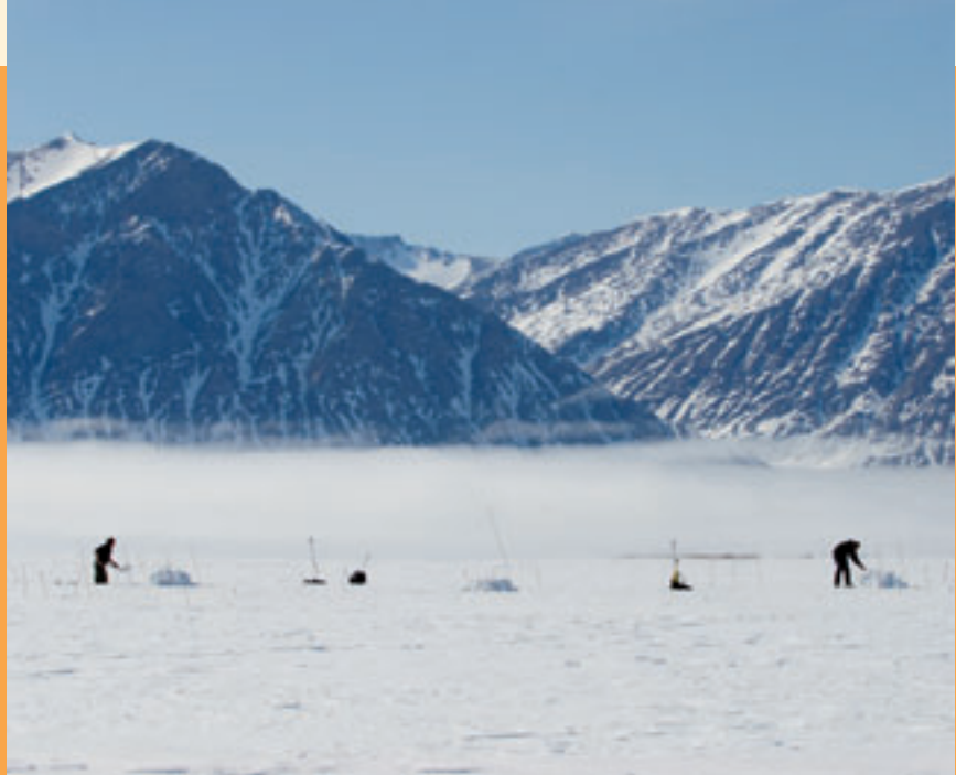
LARS HOLST HANSEN

■ The reaction of the plants to snow melting early or late is being studied in experiments where the snow is either shovelled away or shovelled over, so snow in the test squares melts away at different times.